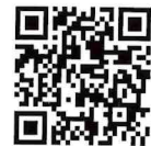
荘内地区健康管理センター 公式Instagram